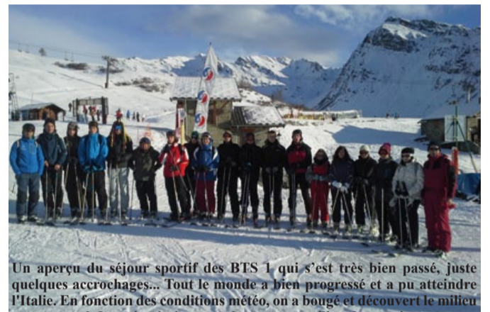
Un aperçu du séjour sportif des BTS 1 qui s'est très bien passé. Juste quelques accrochages... Tout le monde a bien progressé et a pu atteindre l'Italie. En fonction des conditions météo, on a bougé et découvert le milieu montagnard. La neige était au rendez-vous en milieu de semaine...