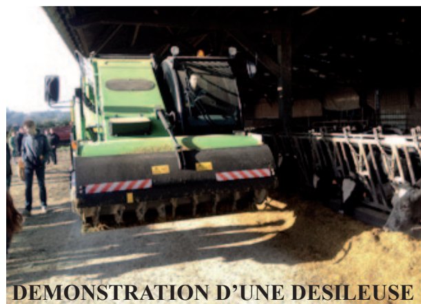
DEMONSTRATION D'UNE DESILEUSE

En visitant cette exposition nos 4 èmes , 2GT, 2TCV, 2 ndes sapat, 1 ère STAV et T erm STAV ont pu s'initier à ce voyage au cœur des atomes... Exposition qui a permis de faire partager aux élèves les domaines de recherche qui visent à comprendre l'histoire de notre Univers grâce à l'étude des objets célestes les plus lointains ou en perçant le secret des constituants les plus infimes de la matière. L'exposition est constituée de 6 machines numériques et interactives dotées de technologies innovantes pour offrir une image dynamique des modèles scientifiques complexes et rendre le visiteur acteur de sa découverte.