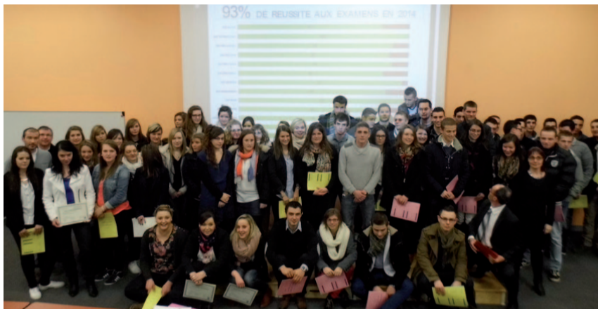
REMISE DES DIPLÔMES 2013 - 2014 : 93% DE REUSSITE AUX EXAMENS !

Visites d'entreprises pour les 4ème de moins de 14 ans : Ces derniers mercredis, les élèves de 4ème de moins de 14 ans ont pu visiter SEB Moulinex, une pharmacie, une entreprise d'horticulture, un supermarché, une gendarmerie... Les élèves ont également entamé un travail sur la lettre de motivation et le CV, afin de se préparer à la recherche de stage, et plus tard, la recherche d'emploi. Ci-dessus la photo de la visite de l'atelier de fabrication des robots, mixeurs, blenders, et machines à café SEB Moulinex de Mayenne.